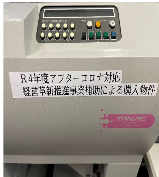
文字部拡大写真（シールの文字が読み取れること）