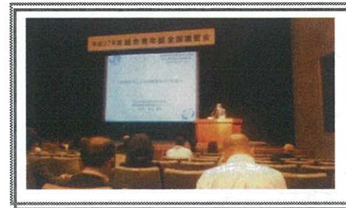
【全国講習会の様子】

全国講習会では、JR西日本より、鉄道を核に地域を起点とした発想に立ち、地域に根ざした社会貢献活動を推進するとの講演があった。また、荒神谷博物館より島根の伝統文化をテーマに講演が行われ、終了後、活発華麗な舞と荘重で正雅・古典的な詞章が特徴的な「石見神楽」が披露され、島根の伝統・文化に触れた。旧日本銀行松江支店の建物を利用した工芸館「カラコロ広場」で懇親会が行われ、松江の地酒が振る舞われた。全国各地から参加した仲間が活発に交流を深め、会は大いに盛り上がりを見せ、全日程を終了した。来年度は神奈川県において開催予定。