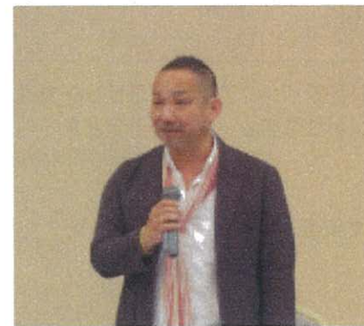
＜丸本青年中央会 会長＞

総会終了後はマツダスタジアムで懇親会を開催し、出席者はお互いの情報交換をするなど交流を深めた。